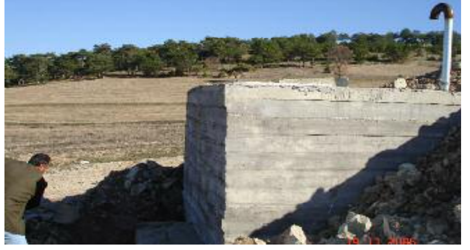
Kanalizasyon Projesinden bir kesit

İkinci proje ilçemizde hayat kalitesini arttırarak, bölgenin ekonomik ve sosyal kalkınmasına katkı sağlamak üzere ilçede bir anaokulu inşaatı yapılarak 4-6 yaş grubu 80 çocuğun yaşam standardının yükseltilmesi projesidir. İlçesimizde yaşayan 4-6 yaş çocuklar (612 çocuk) hedef kitle olacaktır. Samsun İl Özel İdare'since yılda en az 80 çocuğun hayat standardını yükseltme amacıyla bir anaokulu binası ihale yoluyla inşa edilip, donanımı sağlanarak eğitime hazır hale getirilecektir.