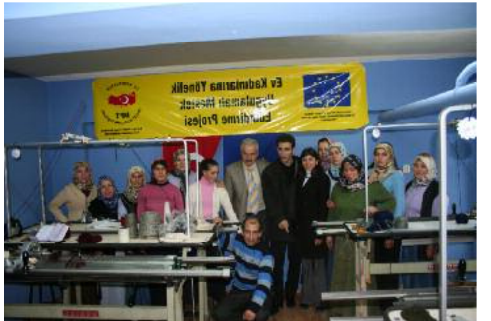
Ev kadınlarına meslek edindirme projesinde çalışanlar bir arada.